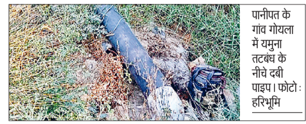
पानीपत के गांव गोयला में यमुना तटबंध के नीचे दबी पाइप लाइन को तोड़ा।

खुर्द में यमुना बांध के नीचे किसानों द्वारा फसल सिंचाई के लिए दबाई गई पाइप लाइन को सिंचाई विभाग के कर्मचारियों ने बंद कर दिया। जिससे यमुना बांध के अंदर करीब 250 एकड़ फसल पानी ना मिलने से प्रभावित हो रही है। इसको लेकर किसानों ने प्रदर्शन कर जताया रोष