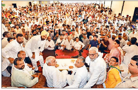
■ पूर्व सीएम भूपेंद्र सिंह हड़्दा ने कार्यकर्ता सम्मेलन में भाजपा सरकार पर जमकर बोला हमला