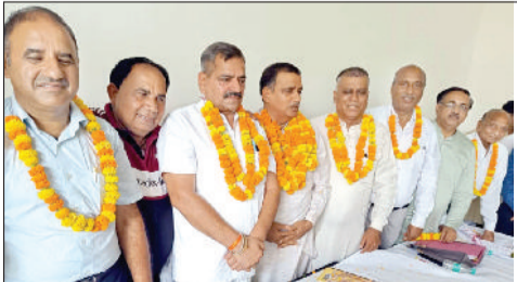
श्री राम दशहरा कमेटी बरसत रोड के पदाधिकारीगण प्रसन्न हैं।