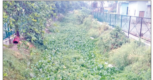
तरावड़ी। शहर के बीचो बीच गंदगी से लबालब बरसाती ड्रेन।

तरावड़ी शहर के बीचो-बीच बरसाती ड्रेन गंदगी से लबालब है। शहर का बरसाती पानी भी इसमें जाकर गिरता है लेकिन इसमें सफाई न होने की वजह से बरसाती पानी घुसने और आसपास की दुकानों में घुसने का खतरा बना हुआ है। पिछले साल भी बरसात के दिनों में इस ड्रेन में बरसाती पानी ना जाने की वजह से पानी दुकानों में घुस गया था। जिससे दुकानदारों का काफी नुकसान हुआ था। आसपास के लोगों का कहना है कि इसका सौंदर्यकरण करवाने के लिए दोनो