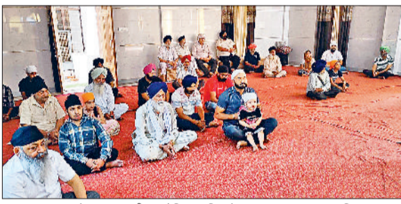
नारायणगढ़। छटे पातशाह श्री हरगोबिंद साहिब के प्रकाश उत्सव पर उपस्थित संगत।