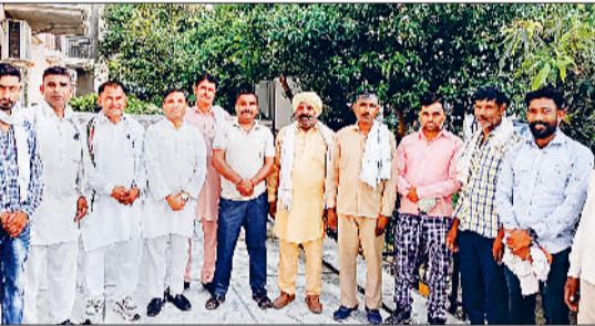
बराड़ा। वाइस चेयरमैन से मुलाकात करते हुए ग्रामीण सफाई कर्मचारियों।