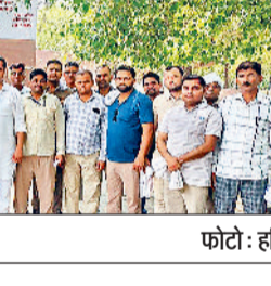
कुरुक्षेत्र। बैठक में मौजूद कर्मचारी।